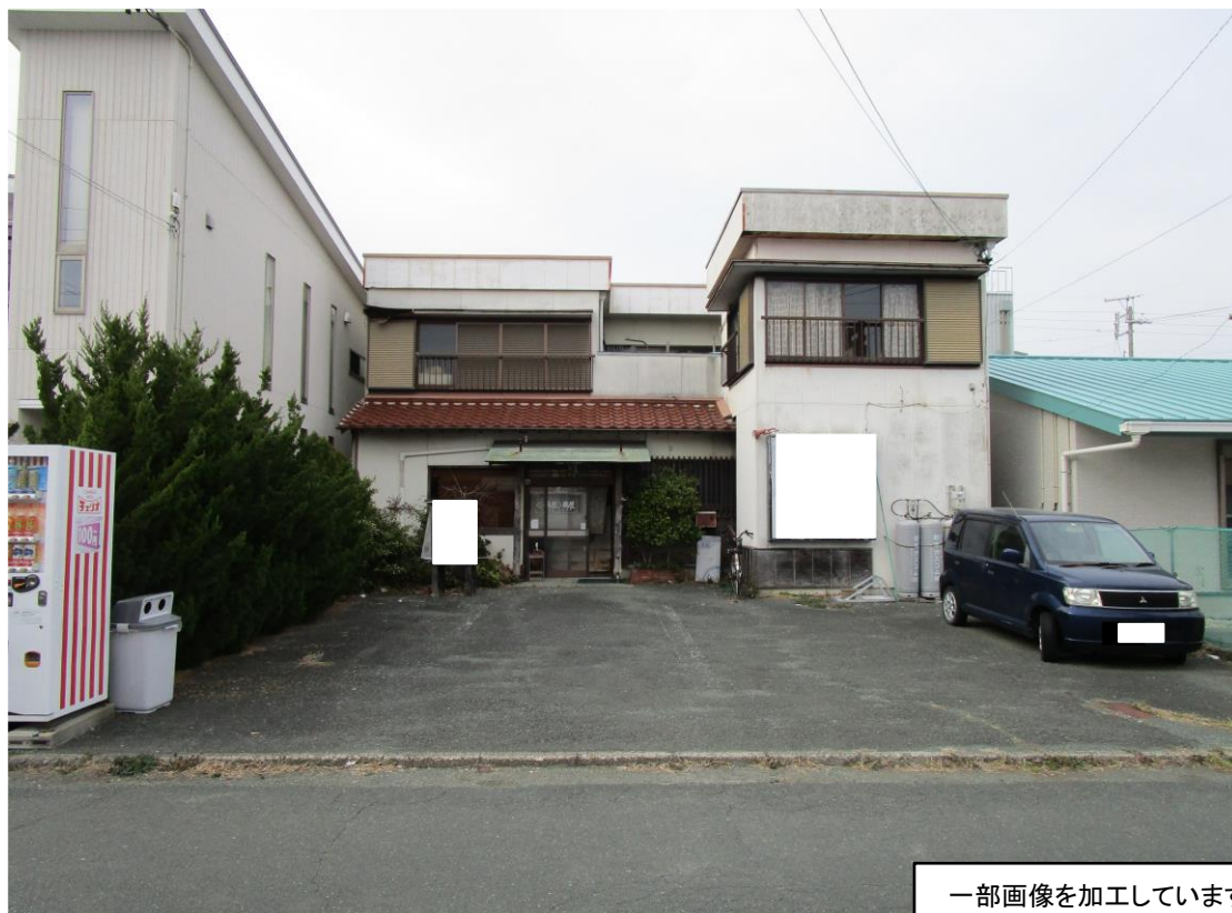
写真① ( 物件正面より撮影 )