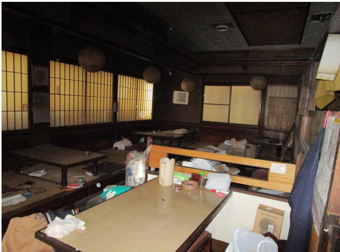
写真② ( 一階元店舗部分写真 )